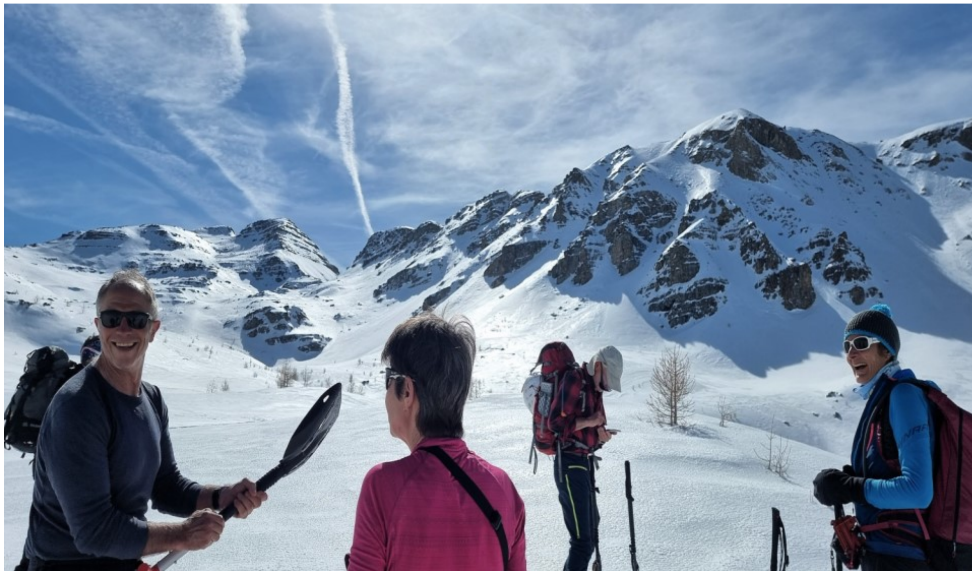
Bayasse mars 2023